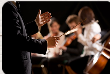
Le Boléro, Maurice Ravel