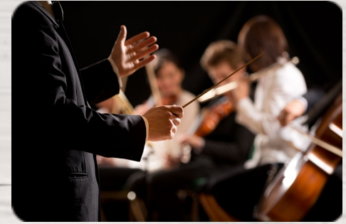
Le Boléro, Maurice Ravel