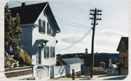
La Maison d'Adam, Edward Hopper