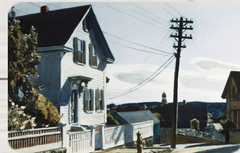
La Maison d'Adam, Edward Hopper